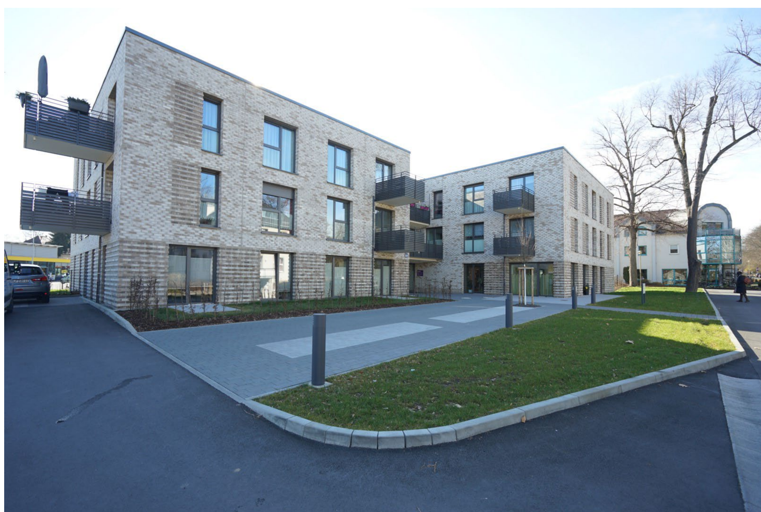
Abb.: Ansicht Nordost