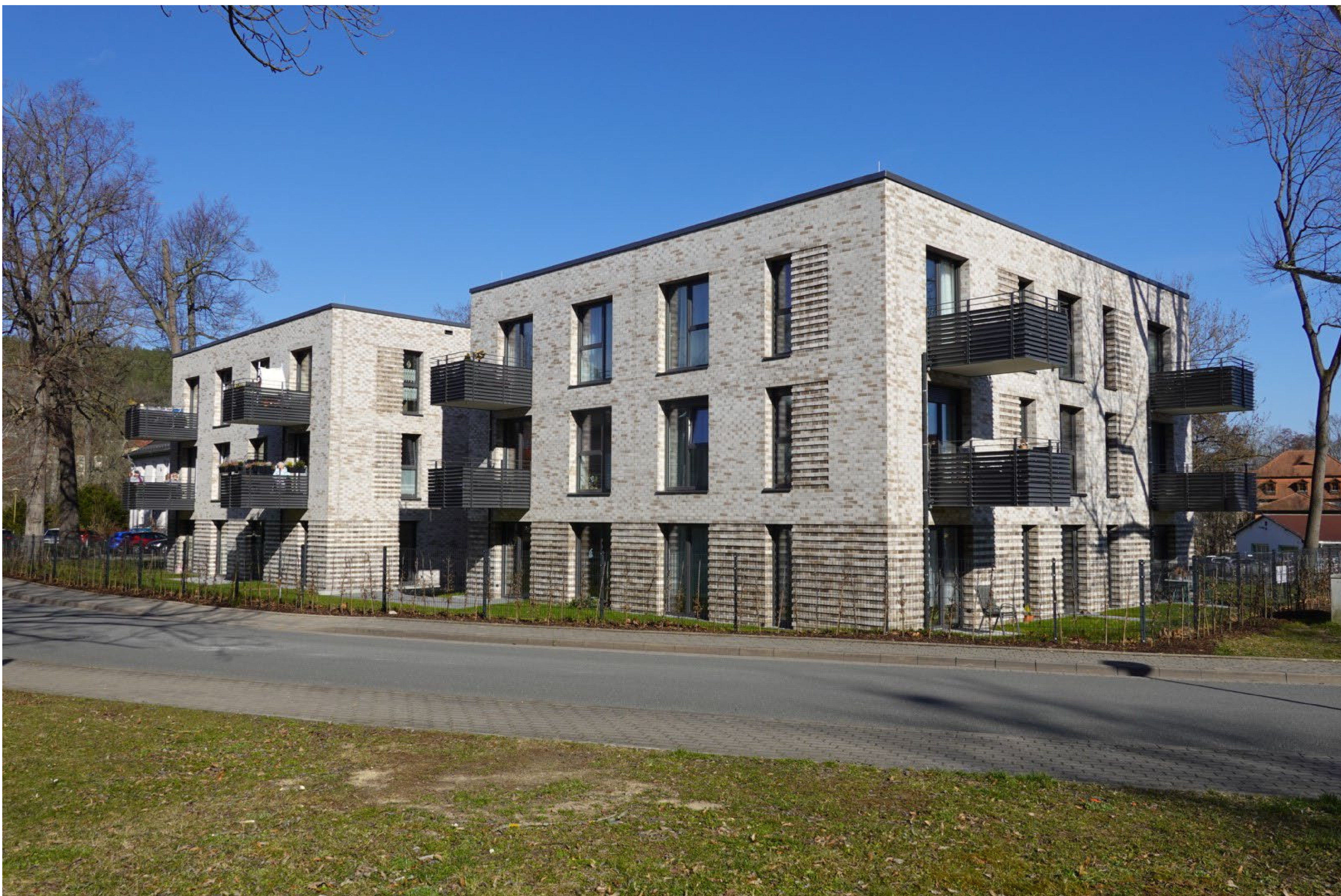
Abb.: Ansicht Südwest