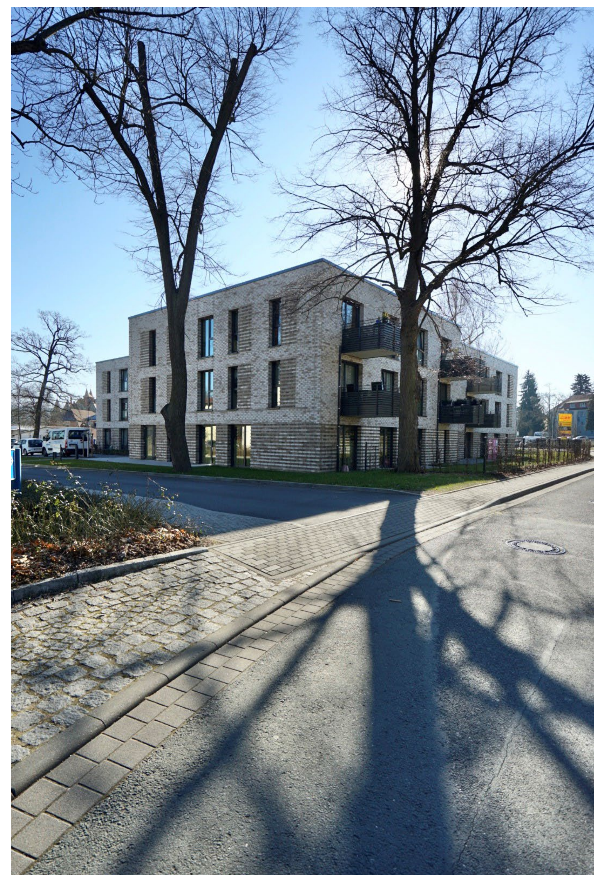
Abb.: Ansicht Nordwest